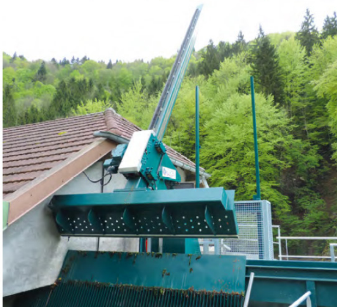
Dégrilleur à crémaillère

Il est constitué d'un bras à mouvement linéaire, commandé par un ensemble oléo-hydraulique, ou moto-réducteur électrique et un automate programmable performant, qui permet un fonctionnement optimisé : gestion suivant pertes de charge au travers de la grille.